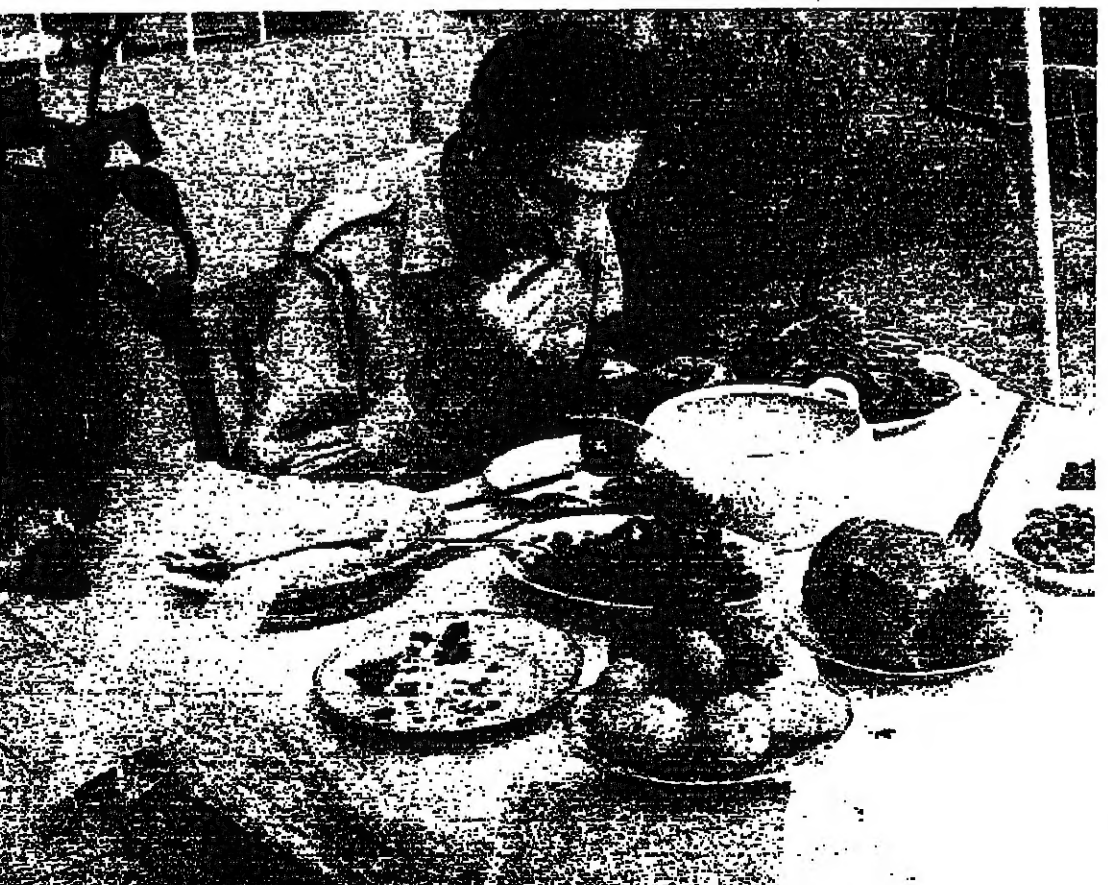
■ لا لحوم على مائدته ■